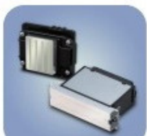
CABEÇAS EPSON/RICOH INDUSTRIAL