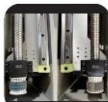
EIXO Y FUSO ESFERA DUPLO