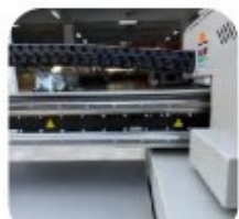
TRILHO SILENCIOSO JAPONÊS THK