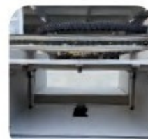
ALTURA DE IMPRESSÃO 40CM